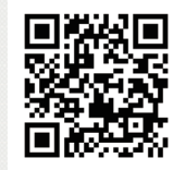
会社説明会予約 各種お問い合わせ